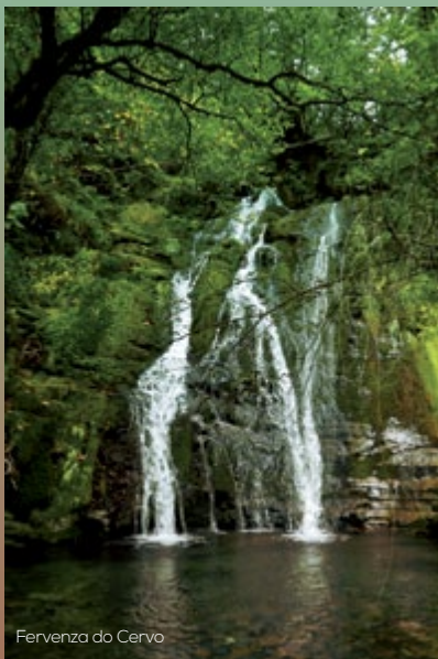
Fervenza do Cervo