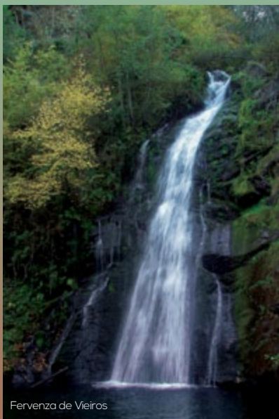
Fervenza de Vieiros